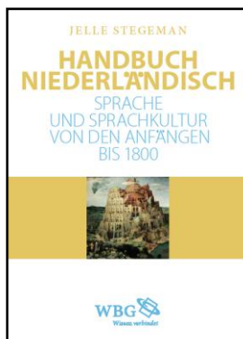
Jelle Stegeman, Handbuch Niederländisch