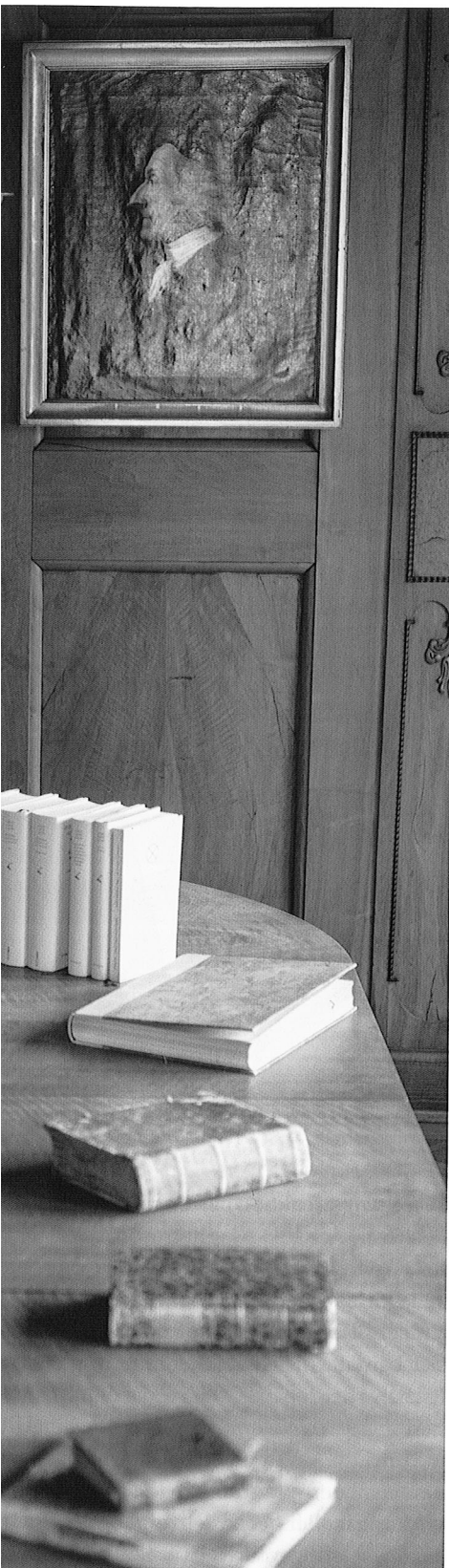
gezhält, mit denen sich Lavater ausgetauscht hat.