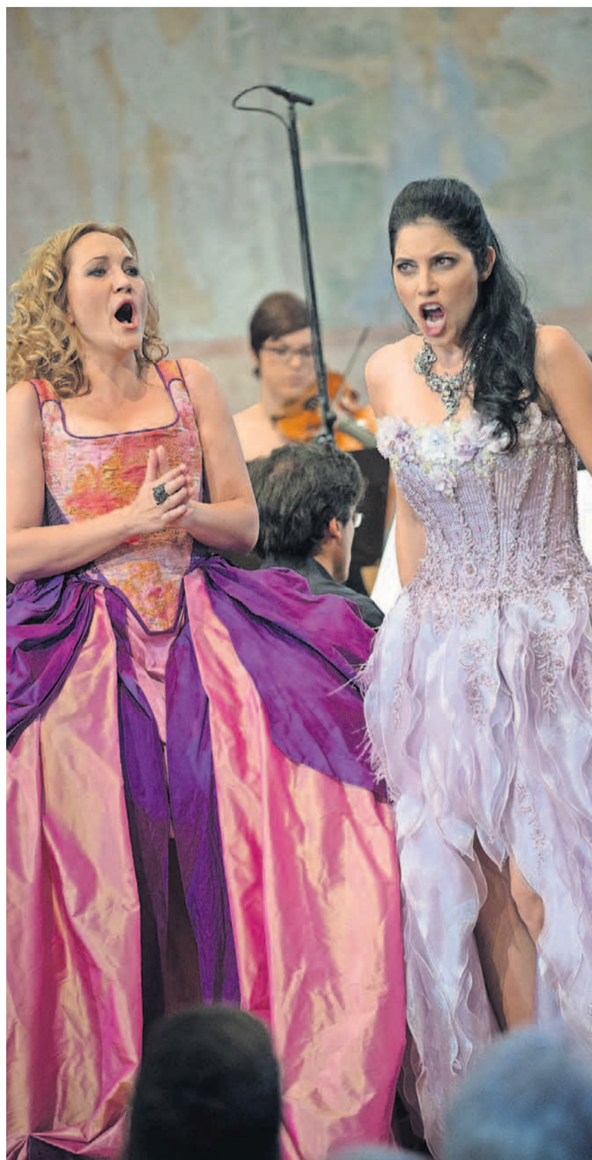
Duell in der Kirche Saanen: Simone Kermes und Vivica Genaux.

Das Menuhin Festival beginnt traditionell mit den Konzerten in der Kirche Saanen: Kammermusikabende, bisweilen Kammerorchesterkonzerte. Stars wie die lettische Geigerin Baiba Skride treten auf. Die Cellistin Sol Gabetta spielt mit der Geigerin Patricia Kopatchinskaja eine Uraufführung von Peteris Vasks. Heute Abend gedenkt man des Schweizer Jazzers George Gruntz (1932–2013) – allerdings nicht in der Kirche. Am 16. August folgt das erste Konzert im 1600 Plätze fassenden Festivalzelt: Klaus Maria Brandauer erzählt den «Sommernachtstraum». Das Gstaad Festival Orchestra tritt auf, in einer Operngala messen sich Diana Damrau, Thomas Hampson und Joseph Calleja . Am 5. September singt Vesselina Kasarova in Bizets «Carmen». Das Finale macht das Scala-Orchester mit Daniel Harding. Neuerdings gibt es nach den Zeltkonzerten einen Gratis-Bustransfer nach Bern. (BEZ) Infos: www.menuhinfestivalgstaad.ch