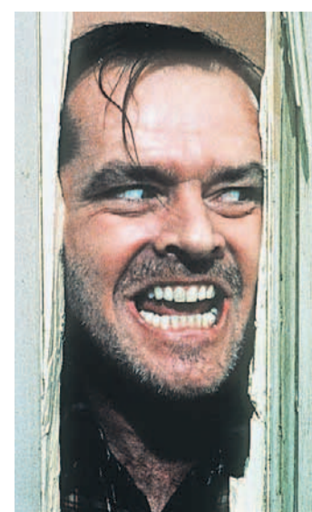
Jack Nicholson als Hauswart Torrance in «The Shining».

DER LEGENDÄRE Horrorfilm «The Shining» beginnt reichlich unpektakulär: Jack Torrance (Jack Nicholson) fährt mit seiner Familie durch die Berge von Colorado zum Overlook-Hotel, das sie über Winter hüten sollen. Der US-Autor Stephen King wollte seine Geschichte, welche die Grundlage für den Kinofilm von Stanley Kubrick bildete, ursprünglich anders beginnen. Er schrieb in den 1970er-Jahren einen Prolog, der von einem räuberischen Baron handelt, der das Overlook-Hotel in die Wildnis bauen liess. Bei der Veröffentlichung des Buches 1977 wurde der Prolog jedoch weggelassen. Nun plant Warner Bros. die Verfilmung dieses Prequels, wie die Branchenblätter «Variety» und «Hollywood Reporter» am Freitag berichteten. Der Film soll «Over-