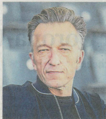
Schriftsteller Lukas Bärfuss.

Leser ist ein schöpferischer Akt. Mit Peter von Matt verschwinden auch Ulrich Bräker, Gottfried Keller und Else Lasker-