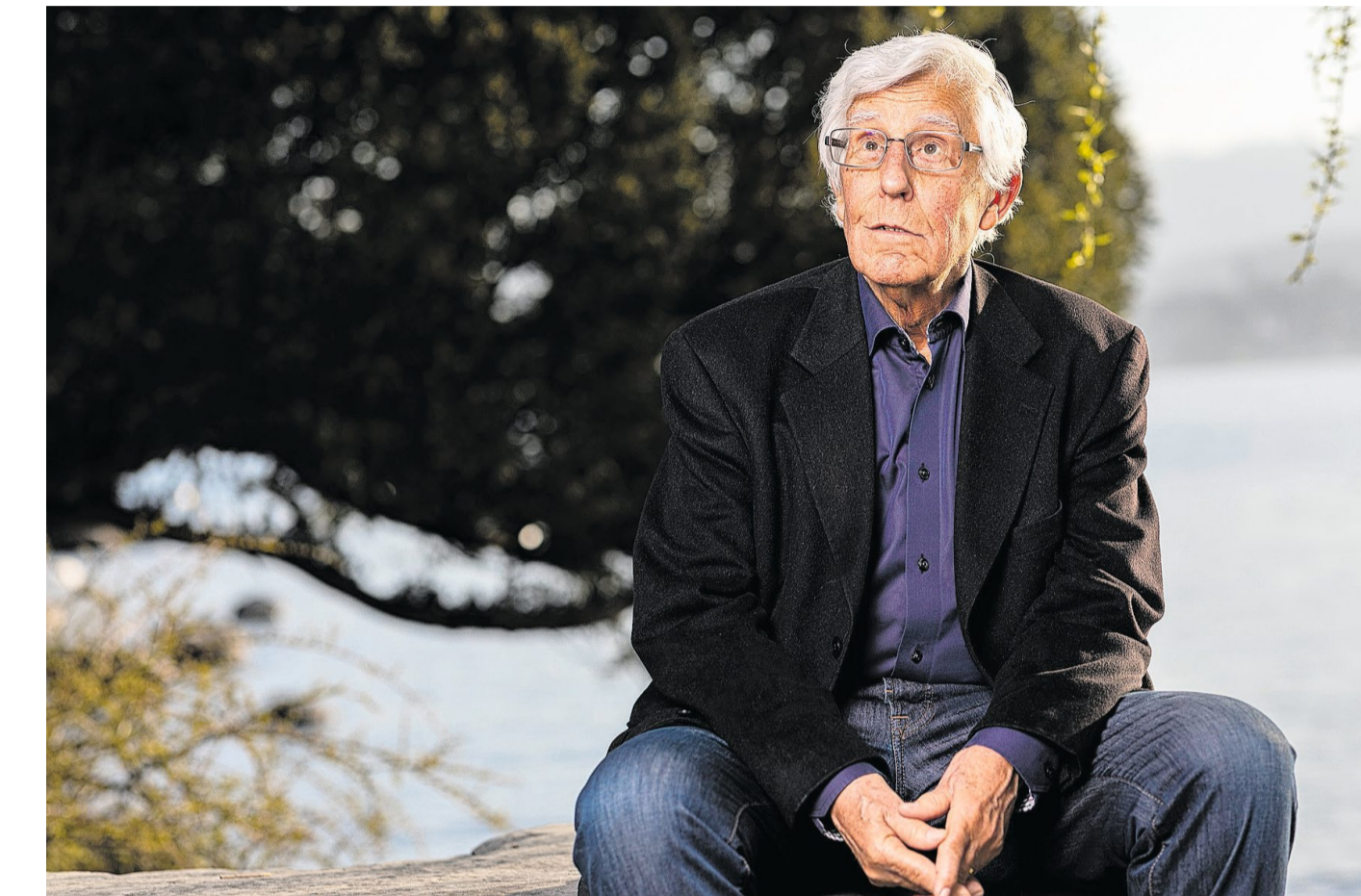
Er zeigte uns, was Literatur vermag: Autor und Literaturprofessor Peter von Matt.

Würde von Matt mein Vorhaben als Nestbeschmutzung empfinden? Ich merkte bald, dass meine Befürchtungen unbegründet waren. Er fand das Thema hoch dringlich und