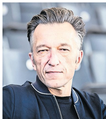
Schriftsteller Lukas Bärfuss.

Lesen ist ein schöpferischer Akt. Mit Peter von Matt verschwinden auch Ulrich Bräker, Gottfried Keller und Else Lasker-