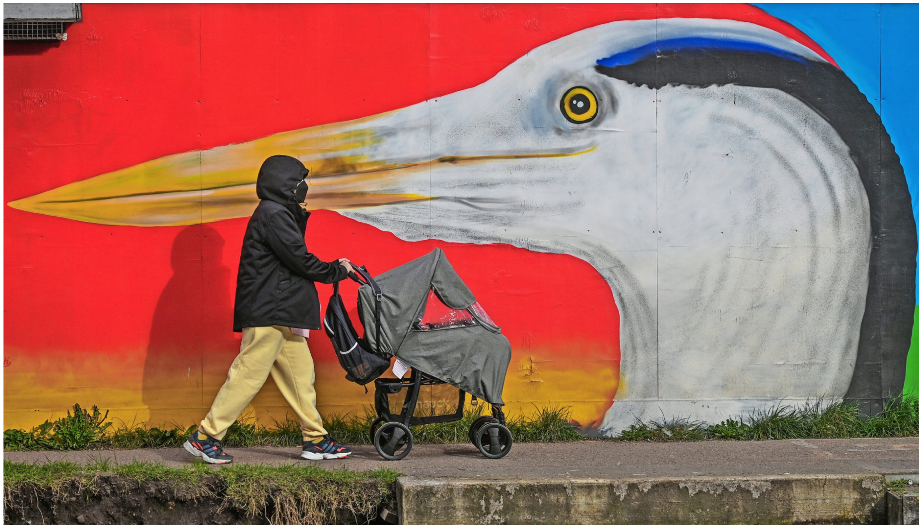
Vorsicht vor schrägen Vögeln: Szene vor einem Mural in Dublin im Februar 2023