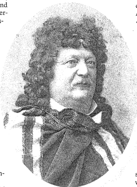
Conrad Ferdinand Meyer, 1887, Radierung: Karl Stauffer-Bern.

Der sechs Jahre ältere Zürcher Rivale Gottfried Keller erzählt gern die Anekdote, wie Meyer ihm vorgeworfen habe, er verschwende seine «Gabe des Styles» an «niedrige Stoffe, an allerlei Lumpenvolk», während er, Meyer, von sich gesagt habe: «Ich arbeite nur mit der Historie, kann nur Könige, Feldherren und Helden brauchen!» Das ist boshaft, aber nicht falsch. In seinen Meisterwerken «Das Amulett», «Jürg Jenatsch» und «Gustav Adolfs Page» bietet Meyer historische Kulissen und Würdenträger en masse auf.